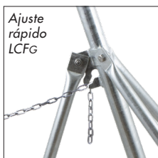
Ajuste rápido LCFg