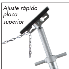
Ajuste rápido placa superior

Siempre se debe usar cadena de seguridad entre los soportes