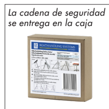
La cadena de seguridad se entrega en la caja